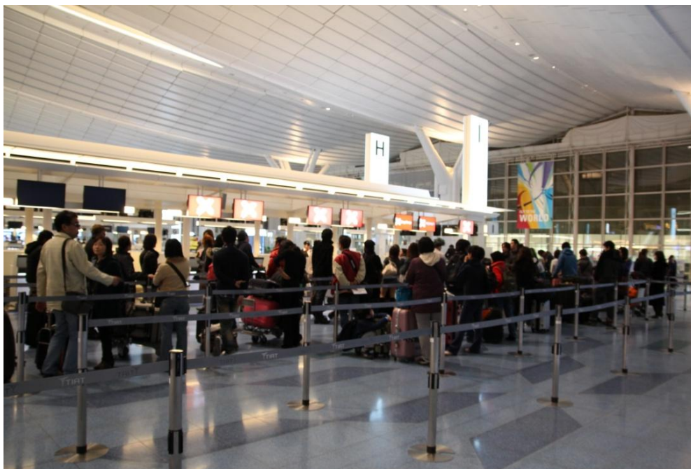
搭乗手続き開始を待つ列はこの後も長くなる