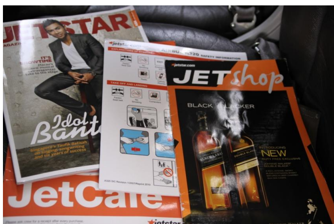
座席ポケットに入っているものは 4種類