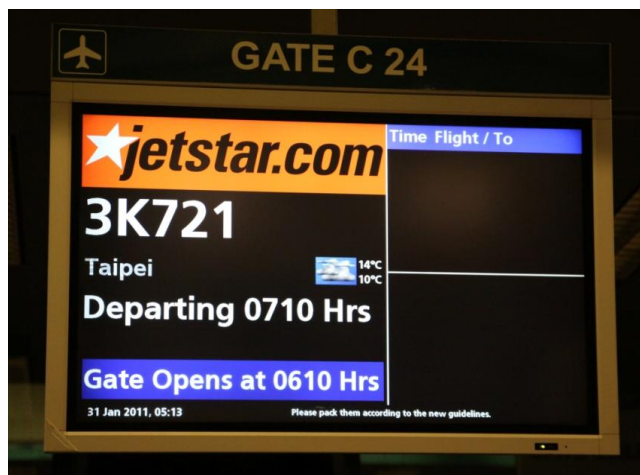
搭乗ゲートのオープンは 6 時 10 分だ

出発 1 時間前の 6 時過ぎに搭乗待合室がオープンした。SIN では旅客の保安検査をそれぞれの搭乗口で実施するようになっていて、搭乗券の改札(手で半券をもぎる)もこの時点で行ってしまうシステムだ。従って手続きを終えた旅客はガラス窓で仕切られた待合室で搭乗を待つことになる。