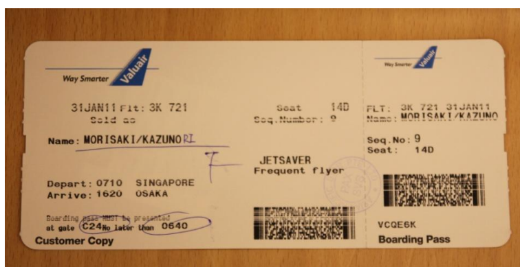
搭乗券は Valuair のものだった

空港までのタグが付いているのだろうか？ちょっと心配になったので窓口のスタッフに確認した。すると彼女は慌てた様子で荷物を流したベルトコンベアーを緊急停止してタグを見に行ってくれた。「大丈夫、関西までになっていますよ。」「OK、完璧だね、有難う」。これで早朝出勤の彼女も目が覚めたかな？などと思いながら次は座席番号、搭乗口と搭乗時刻の確認を搭乗券で確認した。あれッ、搭乗券は見慣れない青色のロゴが印刷された「Valuair」のものだ。Valuair はシンガポールを基点に 2 機の A320 を運航していた LCC であるが、2005 年に Jetstar Asia と合併した。その後も Valuair というブランド名だけは残しているが、Valuair の WEB サイトを見ても内容は Jetstar Asia になっているのが現状だ。搭乗券が Valuair の物を使っている差ほど不思議なことではない。